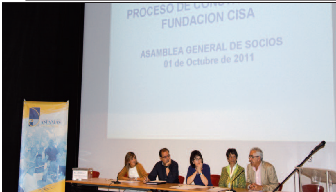
Responsables del proyecto informan a la asamblea sobre la Fundación CISA.