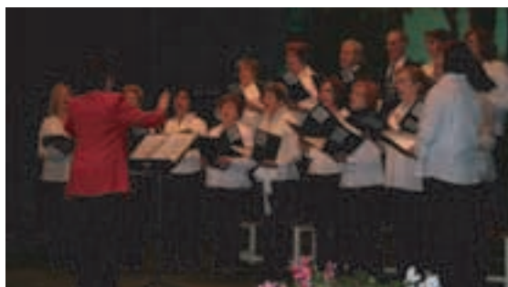
El coro de familias (izqda.) y el grupo de teatro de usuarios, durante su intervención en el Festival.

La novedad del espectáculo de este año fue el debut de la coral de familias de Aspanias (creada este año), que interpretó un repertorio de villancicos navideños. Su actuación fue muy aplaudida por el público. Además, el programa incluyó la intervención de un