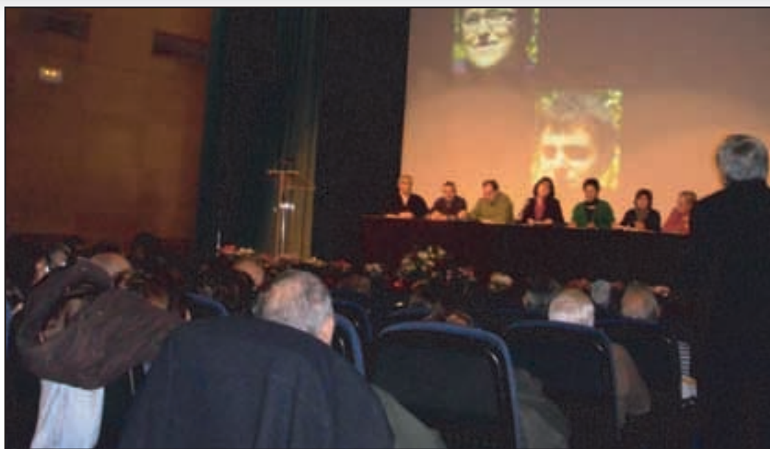
Alrededor de 200 personas asistieron a la última Asamblea General de Socios del año.